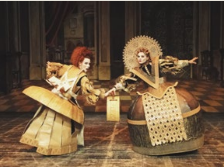
Recreación del vestuario barroco a partir de las pinturas de Carreño de Miranda. Piezas efímeras realizadas en cartón y papel para el montaje de Donde hay agravios no hay celos , de Rojas Zorrilla. Puesta en escena y espacio escénico: Liuba Cid. Diseño de vestuario: Tony Díaz.

comparándose con un dosel y una alfombra, formaban parte del modelo existente en la Antigüedad.