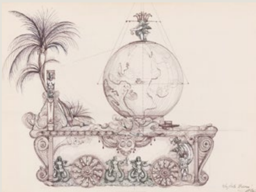
Fiesta Barroca (1992) , dirigida por Miguel Narros. Boceto del carro del Mundo. ©Andrea D'Odorico

Quedaba así establecida la importancia del mito del jardín y del género del paisaje como elementos indispensables para explicar y desarrollar el mundo efímero. Madrid es el Nuevo Paraíso y el mito del Locus amoenus se establece en sus variantes más tópicas, es el caso de la estructura cuatripartita que, en textos paganos y cristianos, posteriormente, se irá cristalizando como imagen idónea del paraíso terrenal.