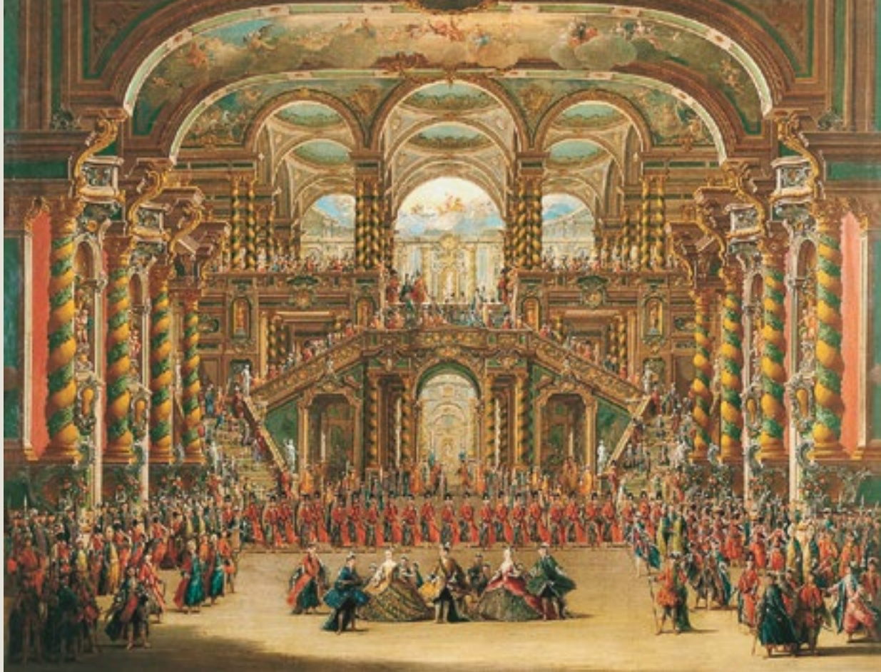
Fiesta en un palacio barroco (1750). Óleo de Francesco Battaglioli por encargo de Farinelli. Real Academia de Bellas Artes de San Fernando (Madrid).

los cuatro elementos. Esta estructura simbólica está en el texto de Alonso Calderón Imperio de la monarquía de España en las cuatro partes del mundo ,... (1636). Europa se vincula con el Aire, Asia con la Tierra, África con el Fuego y América con el Agua. Una pintura que aclara esta estructura es la grandiosa obra de Tiepólo Las cuatro partes del mundo .